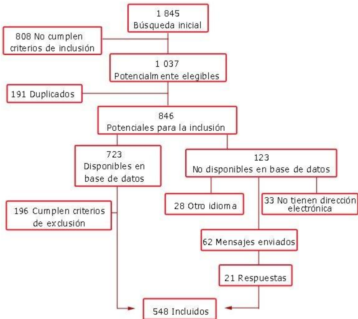
Fig. 1. Algoritmo de selección de artículos.

En el 66,8 % de los estudios se abordó una población enferma, siendo más frecuentes los estudios de calidad de vida en trastornos mentales (21,2 % de las investigaciones), enfermedades infecciosas (8 %) y neoplasias (5,8 %).